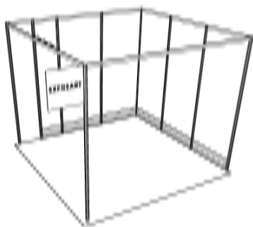
Exemple d'un stand de 9 m 2 avec angle (1 retrait de 0,50m)