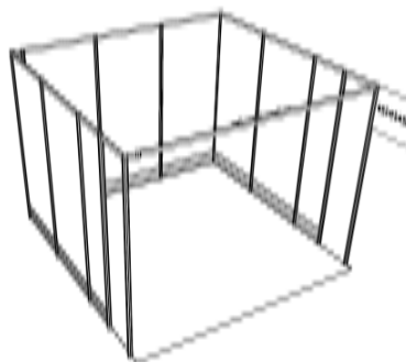
Exemple d'un stand de 9 m 2 sans angle (2 retraits de 0,50m)